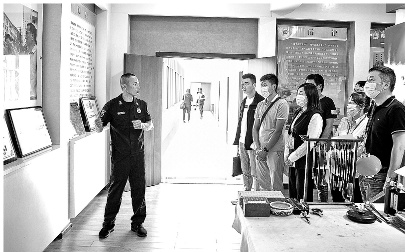
此次受聘的行政执法监督员专业领域水平高,颇具行业代表性。

此次特邀受聘的行政执法监督员分别来自曲靖市人大代表、政协委员、检察机关、公安机关、法律、媒体、企业等各行各业,是一支政治过硬、颇具行业代表性和专业领域水平强的队伍。日常生活中,看到消防通道被占、小区私拉线路充电等各种消防隐患,监督员均可发挥权利作用,给予劝说教育,协助消防部门做好相关工作。