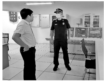
龙熙壹号消防控制室只有一人值班