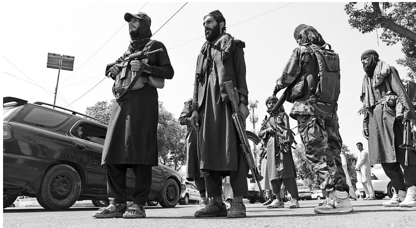
18日,阿富汗塔利班武装人员在喀布尔街头巡逻。