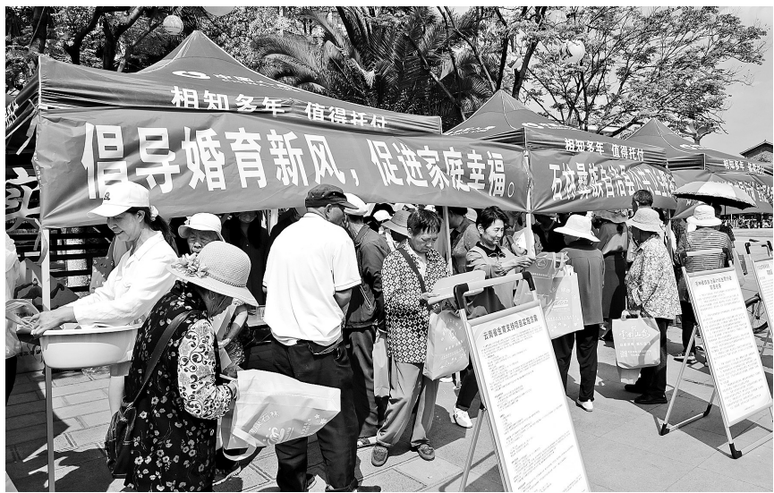
开展宣传服务活动