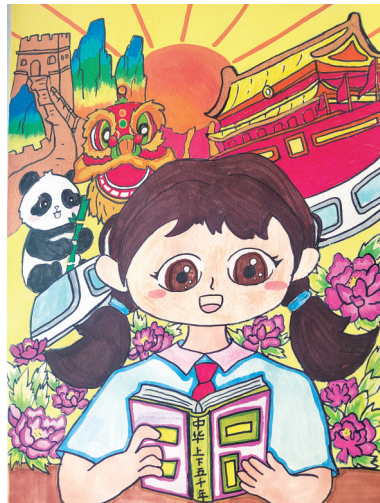
《笔墨润童心,文脉绽新光》 洪叶

作品介绍:作品以纳西坝的草木生机、芙卡洛斯的水之灵动为引,落笔间把草木、海浪、萌宠凑成一幅青春画卷,颂生命多元之美。