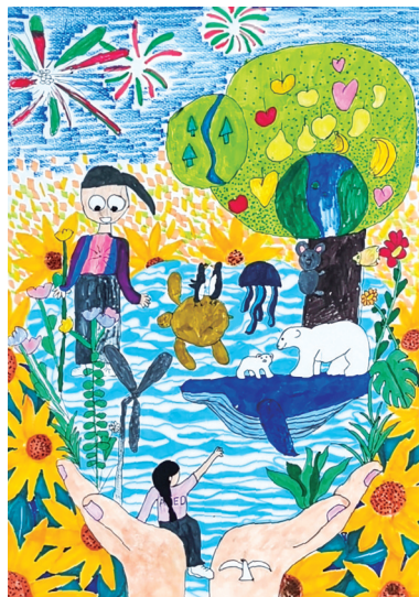
《这是我们的家园》 张晋语

作品介绍:笔墨晕染间,传统与现代文化符号交织,借色彩线条播撒文化自信的种子,在童真视野里启智润心、传承文脉。