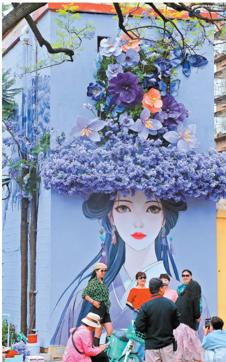
教场中路的《蓝花楹少女》壁画深受市民喜爱