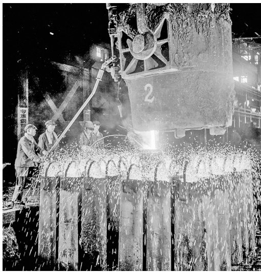
百炼成钢 于上世纪八十年代