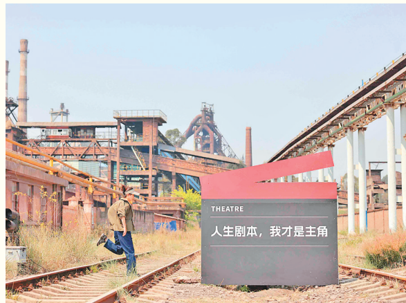
如今，昆钢成了光影片场和文旅打卡地。