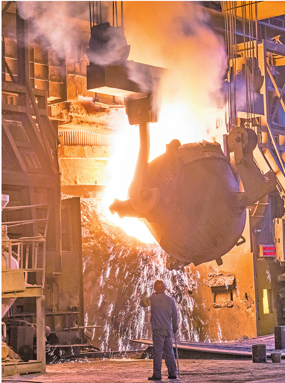
高炉耸立 刘建明摄于2018年

在安宁，一段关于钢铁的记忆，正以一种全新的方式被重新讲述。2023年，高分剧集《漫长的季节》热播，剧中浓厚的工业氛围，让无数观众记住了“昆钢”这个名字。该剧超过70%的戏份取景于昆明钢铁厂本部老厂区——高炉耸立、铁轨延伸，几乎不需额外置景，岁月的痕迹已深深浸染每一寸墙面。剧组主创曾辗转全国多地选景，最终被昆钢独有的“工业废土风”所打动。随着剧集出圈，这片沉睡了多年的老厂区，也重新走进大众的视野。