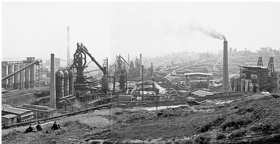
昆钢厂区 杨长福摄于1972年