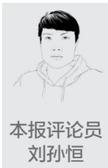
本报评论员 刘孙恒