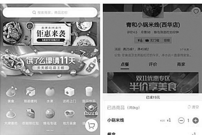
线上线下整合促销