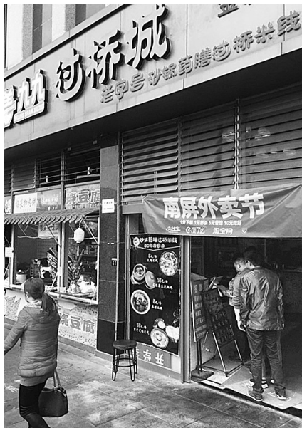
昆明商家利用双11做活动

这周末就是双11,在很多人的印象中,这是电商们的狂欢节,不过这样的场景正在发生变化。当你走进购物中心、餐饮店、小吃店,都会发现线上线下实时互动的体验感越来越真切和丰富。饿了么昆明负责人就告诉记者,此次双11期间,昆明至少超过1万家餐饮、小吃、便利店、鲜花店、水果店、超市商户参与到了大促当中。