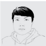
本报评论员 刘孙恒

大数据匹配再怎么精确，终究是根据既有事实理性分析后的结果，可是相恋、相爱偏偏又充满了偶然性、主观性。