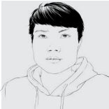
本报评论员 刘孙恒

对于一个明星来说,最主要的是拿作品说话、靠实力上镜,唯有不时产出观众喜闻乐见的作品,同时肩负起一个偶像应有的社会责任,才会是观众心中永远的“C位”。