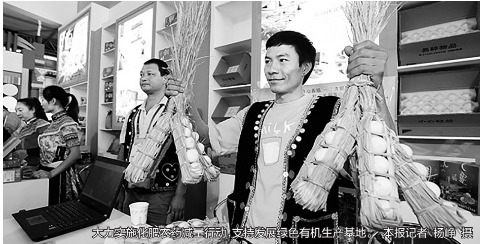
大力实施化肥农药减量行动,支持发展绿色有机生产基地。