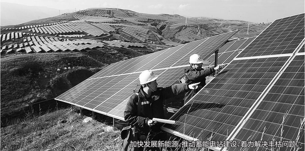
加快发展新能源,推动蓄能电站建设,着力解决丰枯问题。

●推动新能源汽车在建项目如期建成投产、签约项目尽快开工建设,引进电池、电控、电机企业,争取氢燃料电池项目落地。