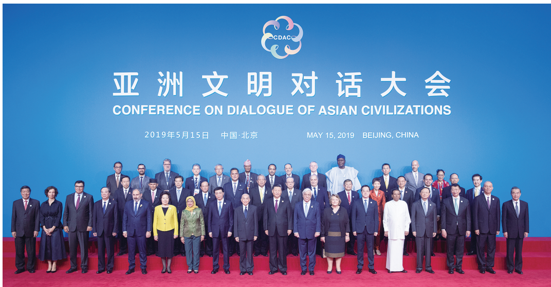
开幕式前,中外领导人同出席开幕式的重要嘉宾代表合影留念。

国家主席习近平昨日在北京国家会议中心出席亚洲文明对话大会开幕式,并发表题为《深化文明交流互鉴 共建亚洲命运共同体》的主旨演讲,指出璀璨的亚洲文明为世界文明发展史书写了浓墨重彩的篇章。亚洲人民期待一个和平安宁、共同繁荣、开放融通的亚洲。我们应该坚持相互尊重、平等相待,美人之美、美美与共,开放包容、互学互鉴,与时俱进、创新发展,夯实共建亚洲命运共同体、人类命运共同体的文明基础。习近平强调,中华文明是在同其他文明不断交流互鉴中形成的开放体系。未来之中国,必将以更加开放的姿态拥抱世界、以更有活力的文明成就贡献世界。