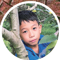
《瑞狮献祥》 / 彭麒元