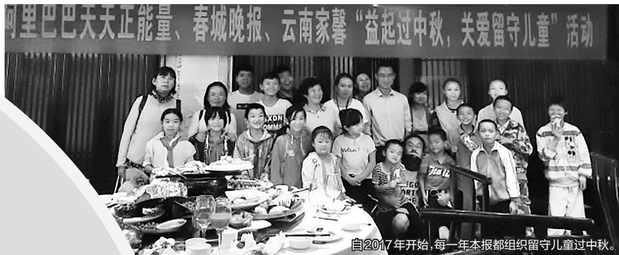
自2017年开始，每一年本报都组织留守儿童过中秋。