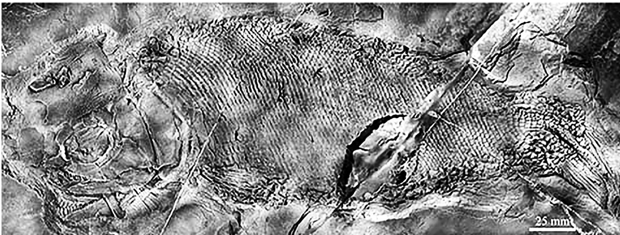
云南暴鱼化石

中国科学院古脊椎动物与古人类研究所(中科院古脊椎所)21日发布消息说,该所徐光辉研究员最新在云南罗平发现世界上迄今所知最古老的疣齿鱼科鱼类化石,命名为“云南暴鱼”。它体长34厘米,是2.44亿年前(中三叠世安尼期)罗平生物群中已知最大的肉食性基干新鳍鱼类,在食物链网中占据较高的位置。 “劫后重生,王者归来。”经历二叠纪