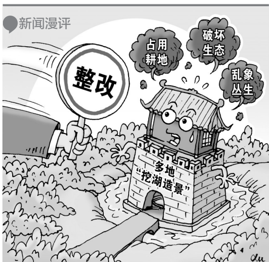
新华社发 徐骏 作

其实，在课间、午休问题上，最需要的是学校和家长在共情基础上达成共识。学校和老师们应当把胸怀放得大一些、担当的勇气多一些。当然，家长们也应有科学、正确的认识，将室外活动的风险视为孩子成长的“必修课”。须知，得与失从来就是共生并存。不经风雨，怎能见彩虹？大人不怕，孩子们的空间才会更广阔些！