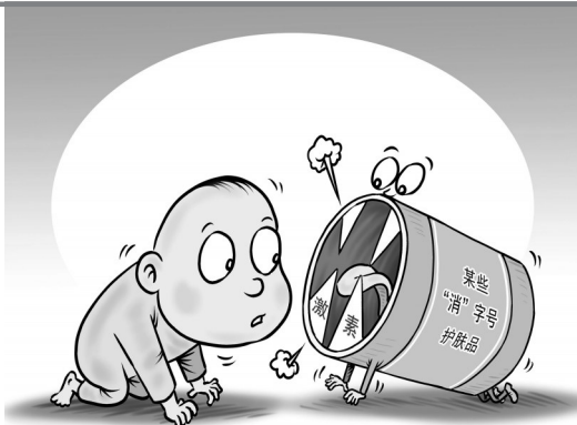
程硕 作

外卖骑手被称为“困在系统里的人”,如果说谁能从这个系统中挣脱出来,平台于他们就只是暂时的落脚点,经过磨练之后,会飞得更高。教育部数据显示,2020年高校毕业生规模达到874万人,再创历史新高。与其抱怨就业难,不如学学这1.2万兼职骑手的在校大学生。捡起地上的六便士,才能看得见月亮。