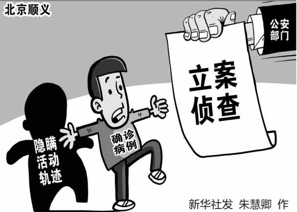
新华社发 朱慧卿 作