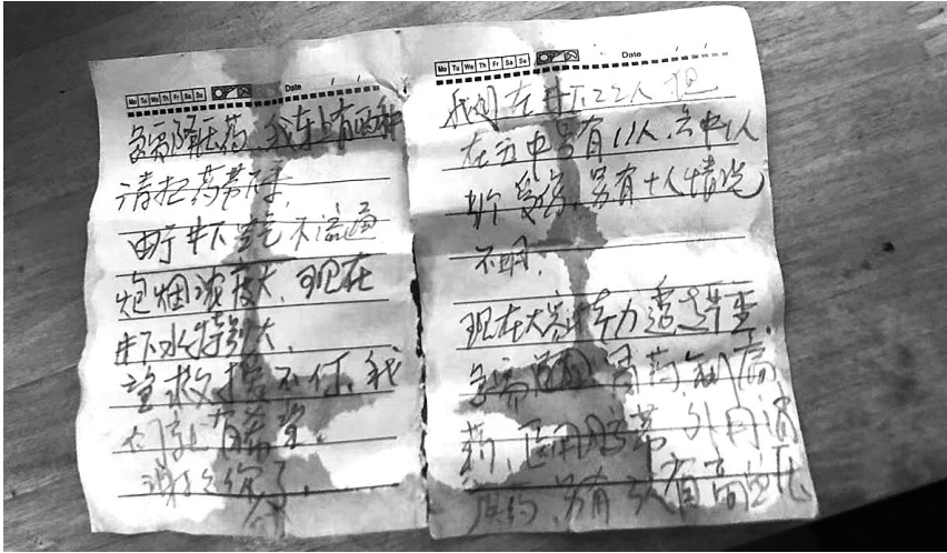
井下被困人员传来的字条

这样一封字迹略显潦草的信,是对生命奇迹最有力的确认。同时,信中透露出井下大量信息,其中井下12人位置确定,但也有10人情况不明!这让救援人员既欣喜又心焦。