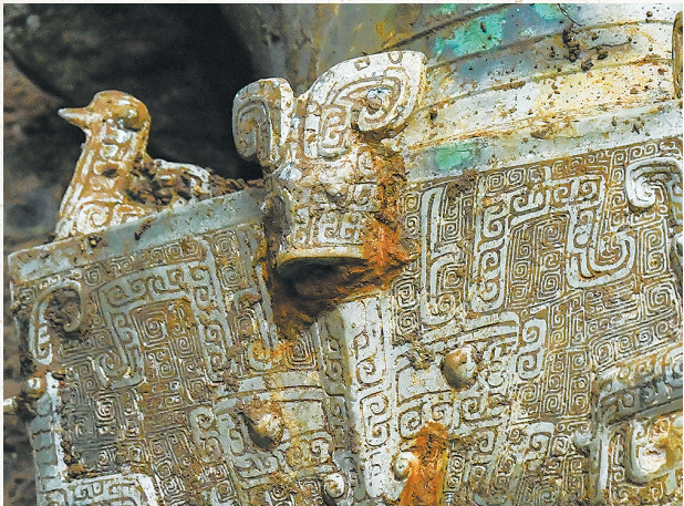
大型青铜器上的精美纹饰