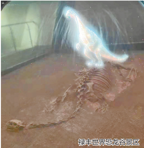
禄丰世界恐龙谷景区

目前，禄丰世界恐龙谷景区依托“中国云南禄丰恐龙国家地质公园”内世界级的恐龙化石埋藏遗址资源，已建成集科普科考与观光娱乐为一体、以“国内一流、国际知名”为目标的科普旅游基地和恐龙文化旅游主题公园。