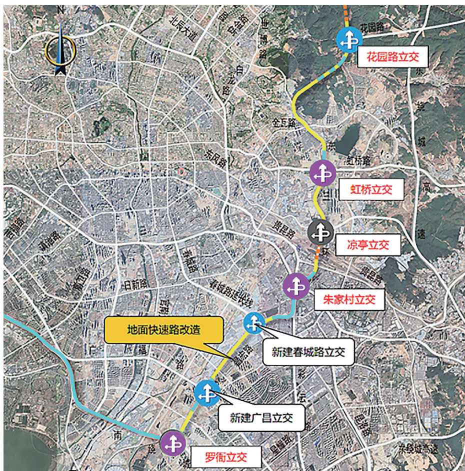
东三环和东北三环道路线形

5月28日,昆明市建设服务中心发布《昆明市三环闭合工程(东三环+东北三环、西三环工程)可研报告编制、勘察设计及前期服务项目招标公告》,首度公布新确定的昆明三环闭合工程道路线形。