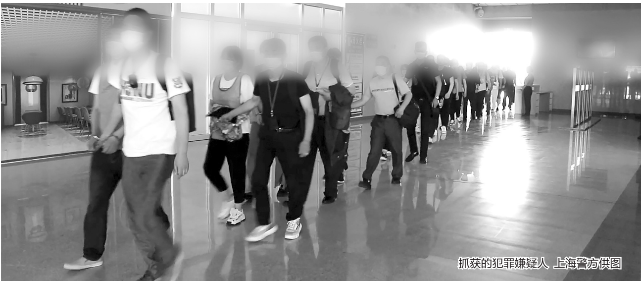
抓获的犯罪嫌疑人