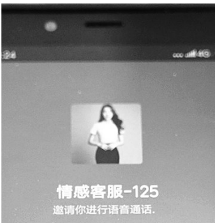
犯罪嫌疑人的微信头像