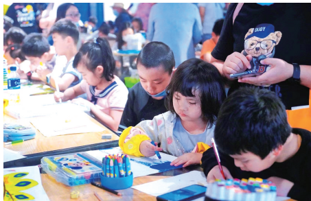
昆明市众多青少年积极参与

99世博会给了昆明这座城市一次放飞想象力、实现城市提速发展的机会。22年来，昆明世博园作为人与自然亲密交融的生态文旅地标，为昆明市民和广大游客带来充足的幸福感和满足感，也成为承载这座城市记忆的宝贵文化遗产。22年后，以“生态文明：共建地球生命共同体”为主题的COP15在昆明举办，世界的目光再一次聚焦春城昆明。在这个特殊的节点，作为生物多样性典范的昆明世博园引