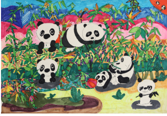
《竹林里的大熊猫》孔维蔓