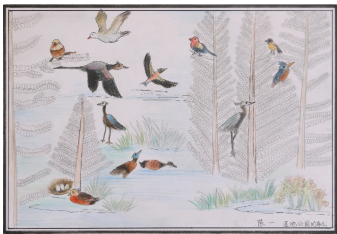
《湿地公园的鸟儿》陈一