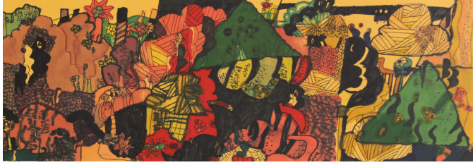
《云南的多彩森林》陈泓妤