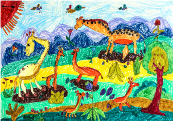
《多彩的草原》关雯心