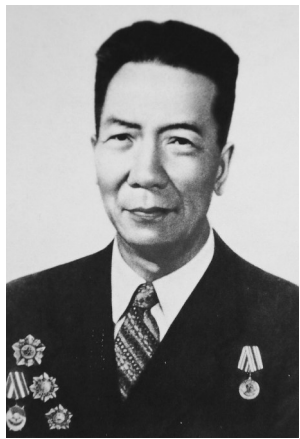
1955年,周保中被授予一级八一勋章、一级独立自由勋章和一级解放勋章。(资料图)

周保中原名奚李元,白族,军事家、东北抗联的创建人和领导人之一。1902年2月7日出生于大理湾桥。早年求学于省立第二中学(今大理一中)。1922年考入云南陆军讲武堂,参加过北伐战争。1927年加入中国共产党。1928年到莫斯科国际列宁学院学习。1931年任满洲省委委员、军委书记。1936年任东北人民革命军第五军军长。1938年任东北抗联第二路军总指挥。历任云南省军政委员会主任、省政府副主席、西南政法委主任等职。1964年2月22日在京病逝。