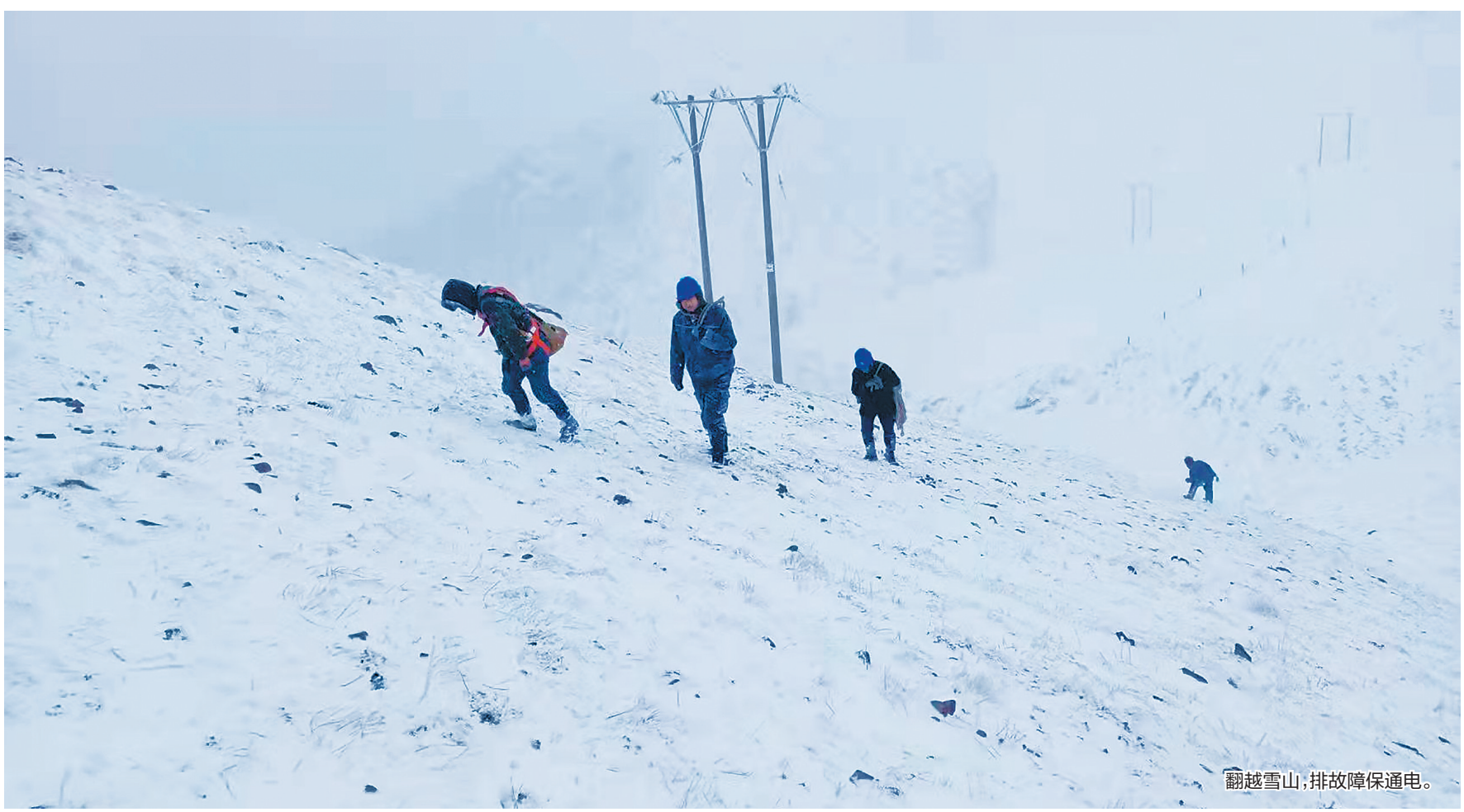
翻越雪山,排故障保通电。