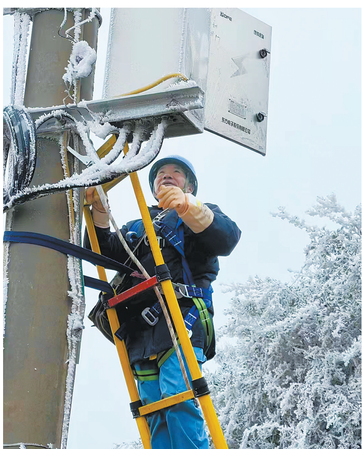
紧急抢修,让用户及时用上电。