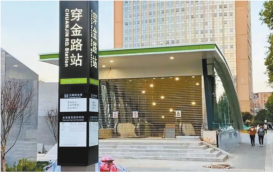
穿金路站各出入口立柱已立好