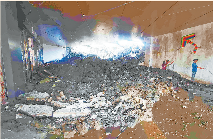
左侧为爱琴海购物公园A馆负一层入口