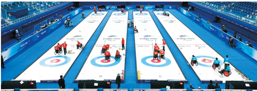
3日,中国轮椅冰壶队在北京国家游泳中心“冰立方”训练。

着在这里比赛了!”来自挪威的残疾人高山滑雪运动员彼得森在“雪飞燕”训练后对记者说,“我有信心在北京滑得更快!”完善的设施和贴心的服务让运动员赞不绝口。