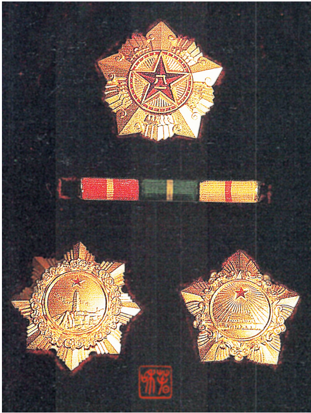
国务院授予周保中的一级八一勋章(上)、一级独立自由勋章(左下)和一级解放勋章(右下)

级组织，把支部建在连上，使部队的领导权牢牢掌握在党的手里。他非常重视部队思想政治建设和组织宣传工作，为了提高部队的政治素质，他编写了《政治学常识》《社会学常识》等材料，组织学习《新华日报》《救国时报》等，同时他还利用一切机会对抗联将士进行时事、政治教育和深入细致的思想政治工作，坚定抗政信心。他英勇顽强，冲锋在前，率先垂范，用模范行动影响和教育抗联将士。周保中同志曾先后五次负伤，其中三次是在东北抗日游击战争中。在一次战斗中，他腹部被子弹打穿，肠子流了出来，他忍痛把肠子塞进伤口继续坚持战斗，在场的抗联将士深受感动。在周保中同志的领导和指挥下，抗联队伍始终保持旺盛的斗志，转战在白山黑水之间，顽强地与日本侵略者斗争，先后谱写出“莲花泡四十二烈士”“十二烈士山战斗”“八女投江”等可歌可泣的诗篇。 抗日战争胜利后，周保中同志回到东北，为我党建立巩固的东北根据地奠定了坚实基础。1946年4月，时任吉林省政府主席、东北民主联军副总司令兼吉辽军区司令员的周保中同志，被毛泽东主席亲自点将，担任长春争夺战的总指挥，指挥部队击溃由伪军、警、宪、特、土匪组成的反动武装2万余人，于4月18日攻占长春，为我军攻打大城市提供了宝贵的作战经验。同时，周保中在东北战场上发挥了对滇军工作的特殊作用。在东北解放战争中，周保中指挥部队与国民党军队进行了800多次战斗，歼敌4万余人，同时还为主力部队输送近19万人，有力支援了全国解放战争。