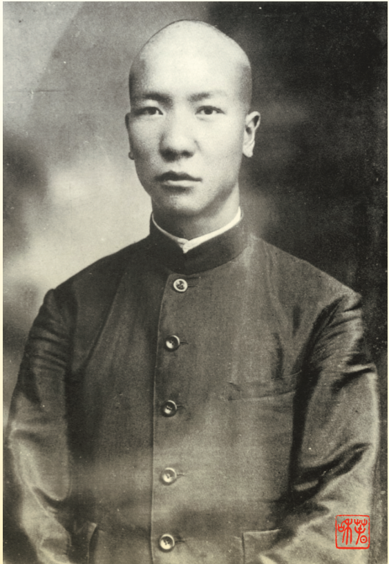
1924年，周保中在云南陆军讲武学校毕业照。