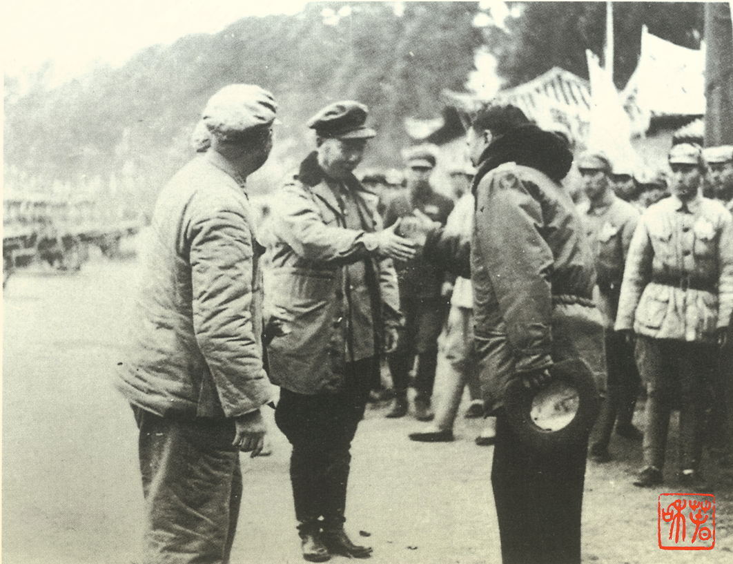
1950年2月20日，周保中与陈赓、宋任穷一道率部进入昆明，与前来迎接的卢汉亲切握手。