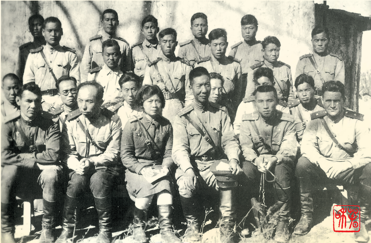
1943年，周保中与东北抗日联军教导旅部分干部合影。