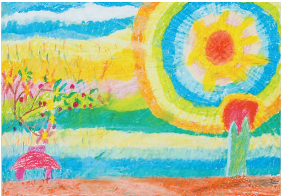
作者系云师大附小文林校区四(7)班学生 《七彩昆明》□ 刘玉璞