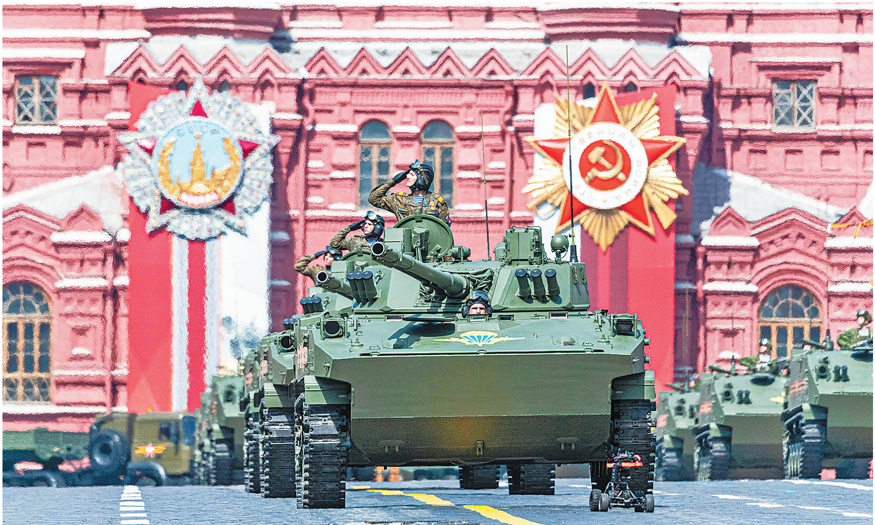
BMD-4M空降战车编队驶过红场