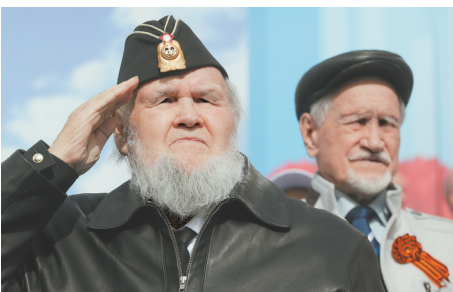
老兵在圣彼得堡冬宫广场观看胜利日阅兵式

俄罗斯9日在莫斯科红场举行阅兵式,纪念卫国战争胜利77周年。俄罗斯总统普京在阅兵式上发表讲话,表示在祖国命运面临抉择之时,保护祖国永远是神圣的。