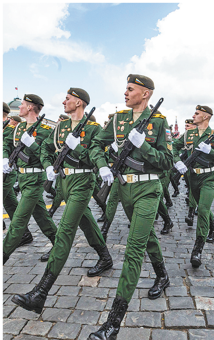
士兵列队走过红场

1945年5月8日当地时间午夜,法西斯德国在柏林郊区的卡尔斯霍斯特正式签署无条件投降书。此时,地处柏林以东的苏联已是5月9日凌晨。苏联将5月9日定为“卫国战争胜利日”。苏联解体后,独联体国家沿袭了这一传统。现在,“卫国战争胜利日”是俄罗斯最隆重的节日之一。