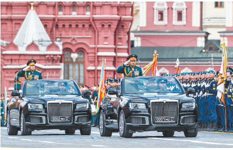
俄罗斯国防部长绍伊古(前)与俄联邦武装力量陆军总司令奥列格·萨柳科夫在莫斯科检阅部队