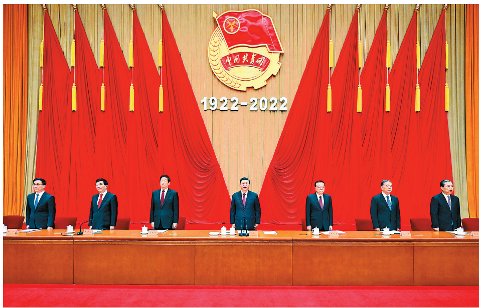
习近平、李克强、栗战书、汪洋、王沪宁、赵乐际、韩正等出席大会。

新华社北京5月10日电 庆祝中国共产主义青年团成立100周年大会10日上午在北京人民大会堂隆重举行。中共中央总书记、国家主席、中央军委主席习近平在会上发表重要讲话强调，青春孕育无限希望，青年创造美好明天。新时代的中国青年，生逢其时、重任在肩，施展才干的舞台无比广阔，实现梦想的前景无比光明。实现中国梦是一场历史接力赛，当代青年要在实现民族复兴的赛道上奋勇争先。共青团要牢牢把握培养社会主义建设者和接班人的根本任务，坚持为党育人、自觉担当尽责、心系广大青年、勇于自我革命，团结带领广大团员青年成长为有理想、敢担当、能吃苦、肯奋斗的新时代好青年，用青春的能动力和创造力激荡起民族复兴的澎湃春潮，用青春的智慧和汗水打拼出一个更加美好的中国。