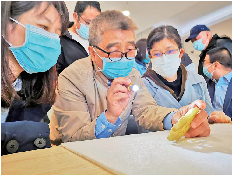
国家文物责任鉴定员为观众鉴宝

5月18日,“源于泥土——建水紫陶艺术展”在云南省博物馆开展。展览用省博物馆28件馆藏文物和建水县304件紫陶作品,讲述了“‘窑’望千年”“‘刻’艺求精”“‘我’语陶泥”三个篇章,把观众的视线从单一的“物质”转移到“非物质”的文化逻辑,多方面展示了建水紫陶的过去、现在及未来。展览将持续至6月18日。