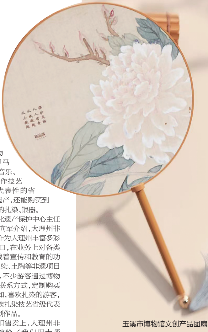
玉溪市博物馆文创产品团扇

目前,曲靖市博物馆设计了系列文创产品。诸如,给胶带、帆布包、行李牌、手机壳等赋予文物文化特征;在马克杯、咖啡杯、杯垫、桌布等上面设计青铜剑鞘、蛙人等形象,赋予传统美好寓意;以青铜器主题文创IP开发儿童立体纸公仔等产品。将曲靖文物元素融入实体文创产品,旨在通过有型的产品传递博物馆文物和文化特征。