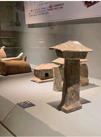
晋宁区博物馆陶房屋模型