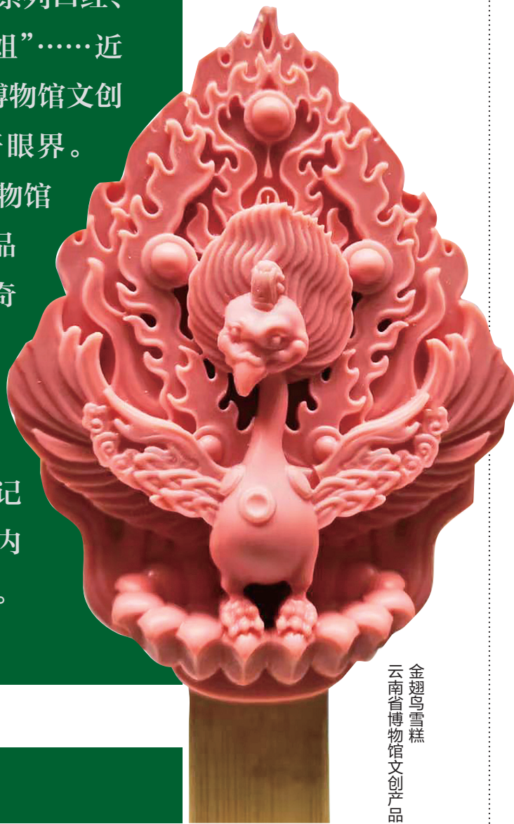
金翅鸟雪糕 云南省博物馆文创产品

“宫猫卷卷贴纸”、《千秋绝艳》系列口红、“唐宫小姐姐”……近年来,全国博物馆文创界让人大开眼界。云南各地博物馆的文创产品又有哪些奇思妙想?在“5·18”国际博物馆日,本报记者走访了省内多家博物馆。