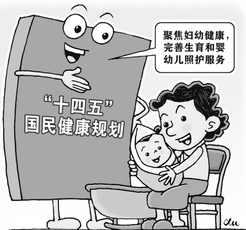
新华社发 徐骏 作