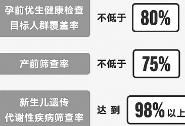
宋博 制图