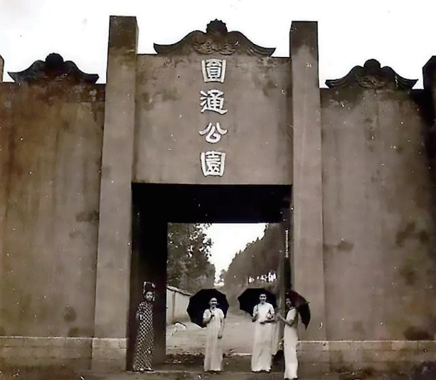
1936年修建的石碑楼大门,摄于1944年。

碑——碑体通高9.7米,碑上刻有阵亡的3775名士兵和125名军官的名录。 1944年6月4日,松山战役打响,中国远征军总预备队新编第八军于9月7日攻克日军阵地。这场激战中,中国军队伤亡惨重,日军除一人突围外其余全部被歼。松山战役是抗日战争中最为惨烈的战役之一,是滇西大反攻的首战之地也是决战之地,它拉开了滇西大反攻的序幕,为打破日本的封锁奠定了基础,在中国抗战史上具有重要意义。 缅甸战役中国阵亡将士碑(简称“安澜纪念碑”)——碑体全高8.53米,塔基正面用简笔形象地勾勒出了戴安澜将军形象,他身着军服,气宇轩昂。 戴安澜,国民革命军高级将领,曾参加北伐战争,参与古北口、台儿庄等战役。1942年,奉命率200师作为中国远征军的先头部队赴缅参战。1942年5月18日,在郎科地区指挥突围战斗时负重伤,26日在缅甸北部茅邦村殉国。他在抗日战争中战功显赫,抗战胜利后被迫认为革命烈士。