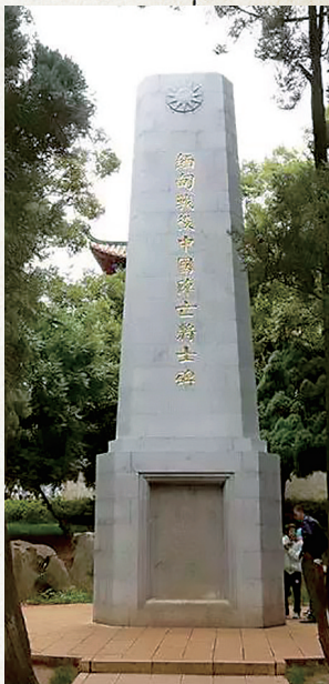
缅甸战役中国阵亡将士碑