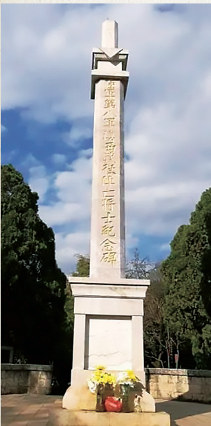
陆军第八军滇西战役阵亡将士纪念碑