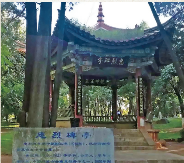
忠烈碑亭