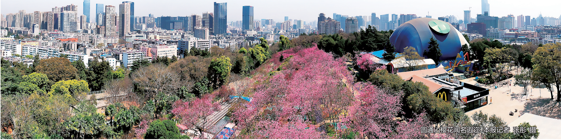
圆通山樱花节名园邂逅