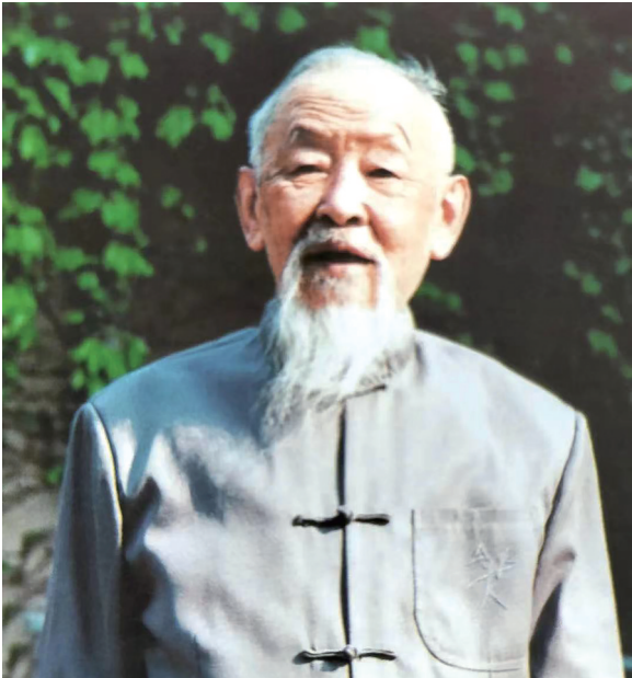
李群杰是德高望重的革命老前辈,也是我国著名书法家。

李群杰(1912—2008)是纳西族历史上最早的中国共产党党员,也是抗战期间云南地下党的一位主要负责人。在70多年的革命生涯中,李群杰把自己无私奉献给了民族独立、人民解放和社会主义建设的伟大事业,铸就了一个大写的人生。