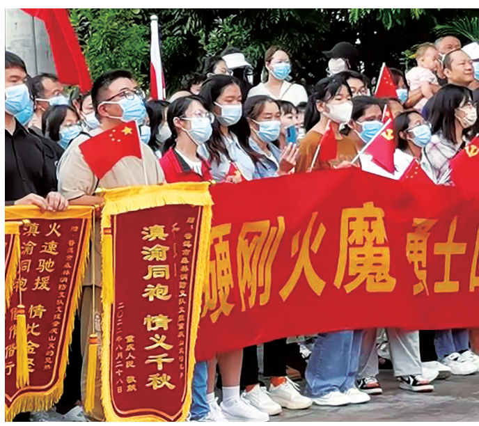
你们为家乡“长脸了”，欢迎回家。