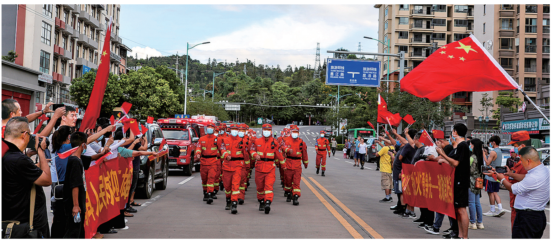
普洱群众欢迎勇士荣归驻地