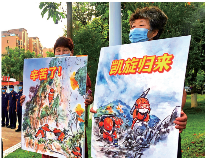
群众绘画再现扑火场景，表达深情厚谊。