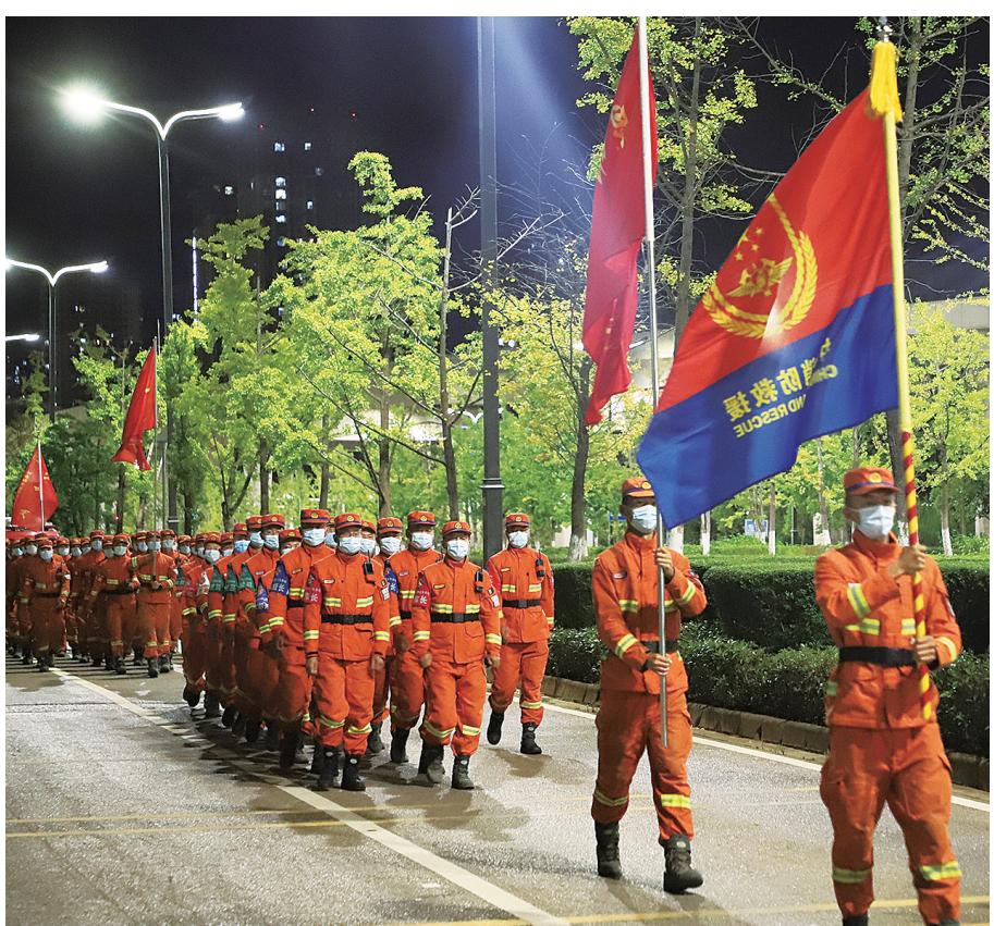
昨夜今晨，森林消防昆明支队平平安安回来了，一个都没有少。