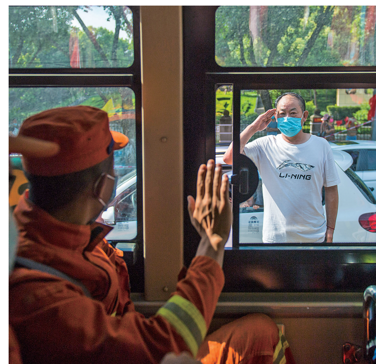
请接受一名老兵的敬意