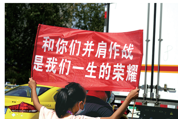
人民的信赖就是最大的鼓励