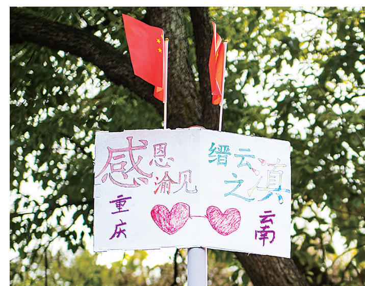
滇渝同心，其利断金。