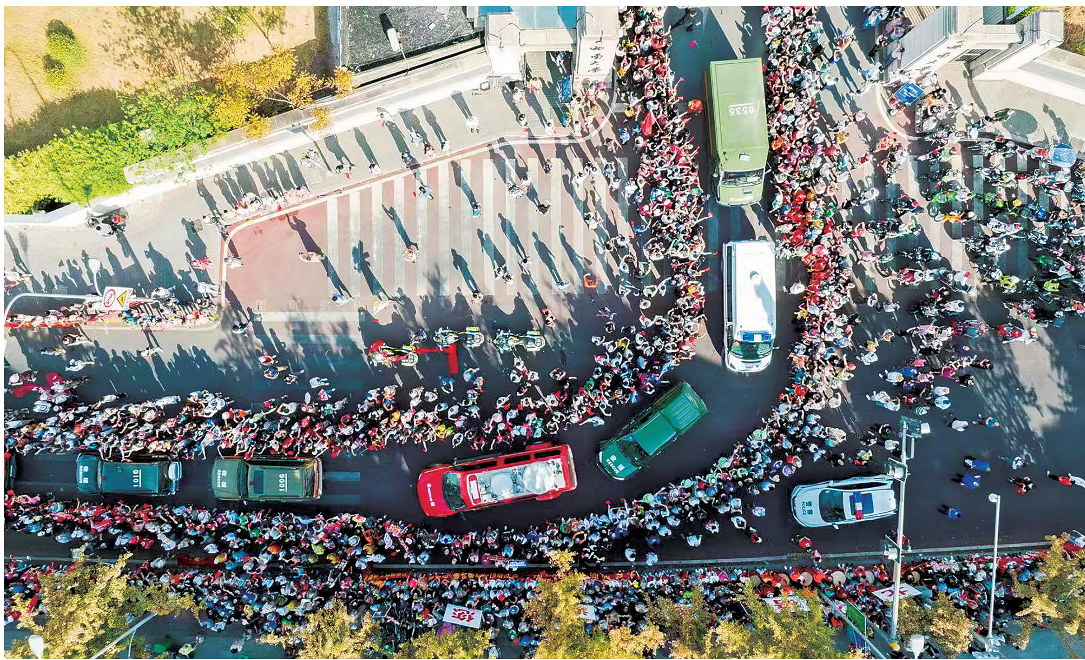
网友：这辈子首次见到这么大的场面。