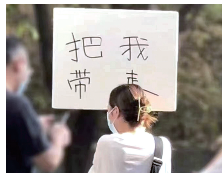
带不走火锅么，把我带走嘛。