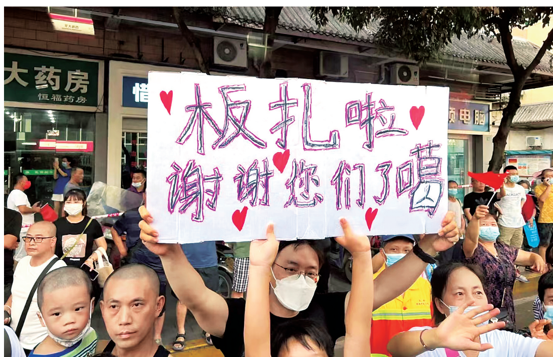
我们的昆明话地道吧？