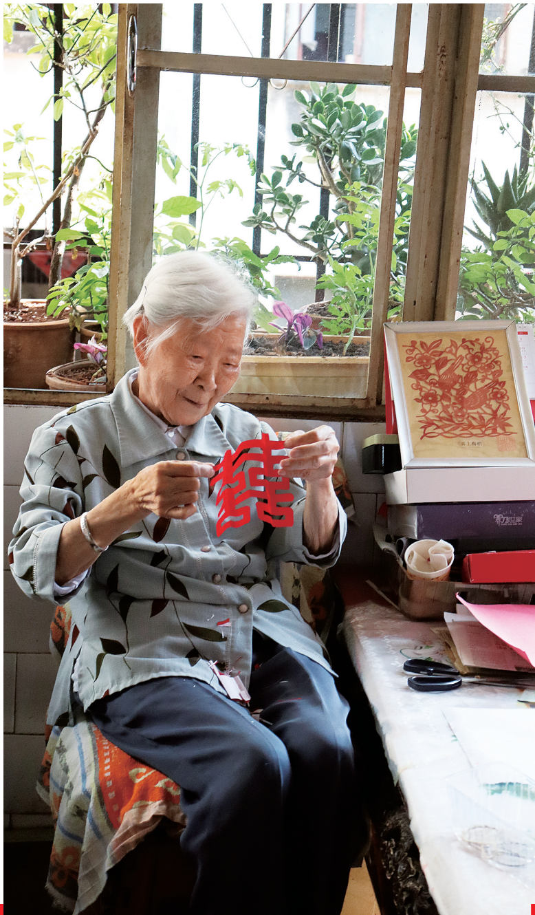
张奶奶轻松剪出一个“囍”字