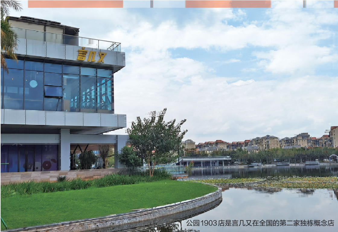
公园1903店是言几又在全国的第二家独栋概念店

闲、文创产品、主题餐厅、文化互动、儿童阅读区、儿童乐园等形态于一体。如今,这些精心的设计已不知所终。 2021年下半年,言几又书店拖欠员工数月工资、拖欠供货商货款的事件在网上曝光。今年9月,言几又在北京的8家门店已全部关闭,在杭州、广州、厦门的门店也陆续关闭。记者注意到,目前,言几又的官方网站已无法正常打开,微信小程序的线上商城也已无法正常购买。