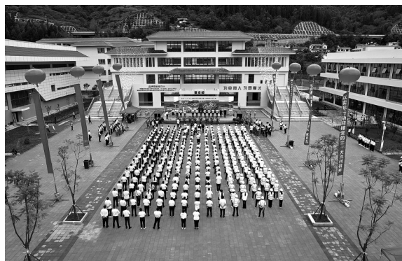
恢复重建的漾濞县第一初级中学