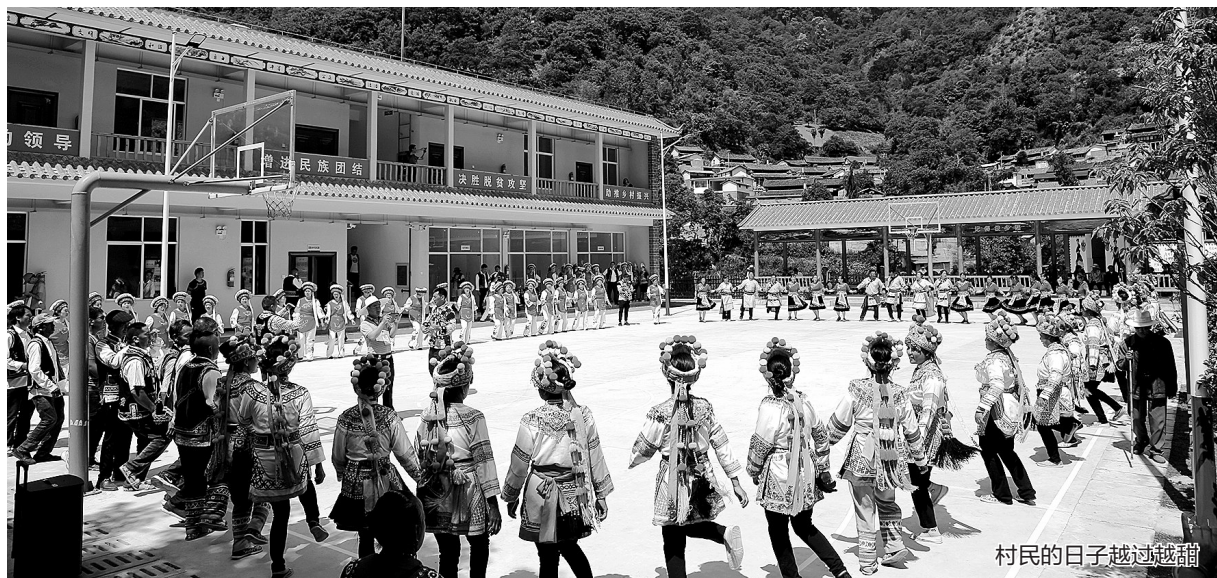
村民的日子越过越甜