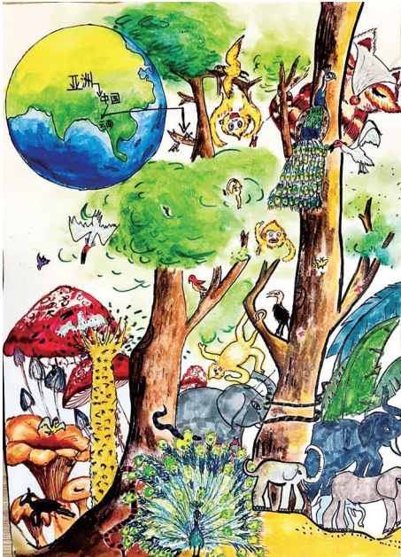
《大美云南》 □ 金慕涵