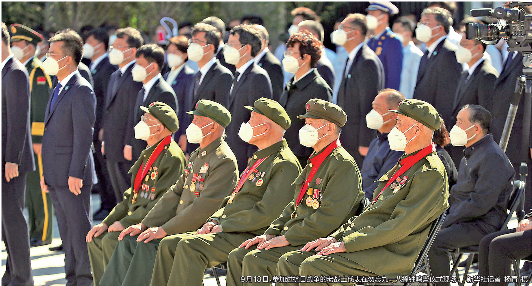
9月18日,参加过抗日战争的老战士代表在勿忘九一八撞钟鸣警仪式现场。