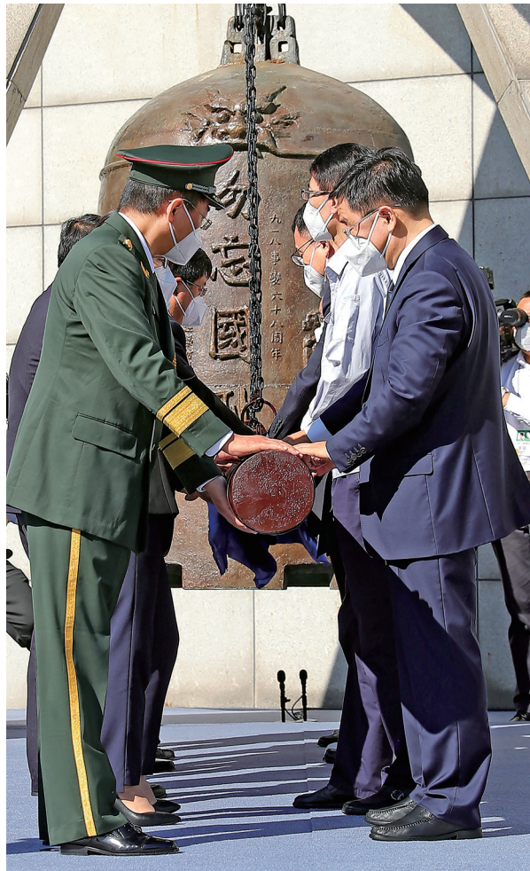
撞响“警示钟”