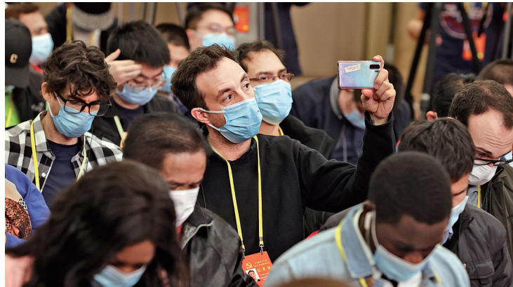
中外记者聚焦大会,传递大会声音,讲述发展故事,成为一道别样的风景。