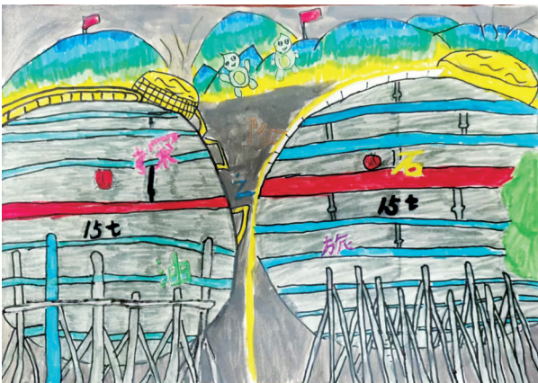
作者系云师大附小金安校区三(二)班学生 《石油燃气探秘之旅》 □ 马誉恩