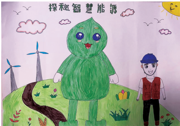
作者系关上实验学校二(二)班学生 《探秘智慧能源》 □ 倪晨皓