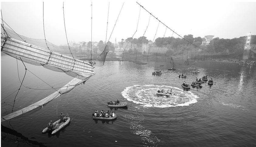
10月31日，救援人员在印度古吉拉特邦的桥梁断裂事故现场展开搜救工作。

据媒体报道，这座拉索桥长 233 米，宽 1.5 米，建于 1880 年。经过数月维修，于 10 月 26 日重新对公众开放。