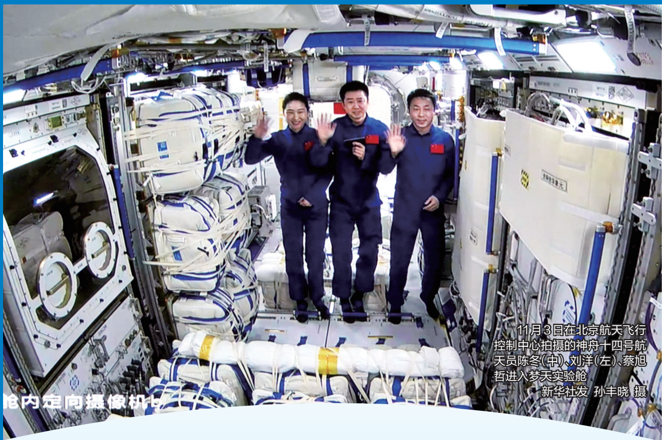
11月3日在北京航天飞行控制中心拍摄的神舟十四号航天员陈冬(中)、刘洋(左)、蔡旭哲进入梦天实验舱