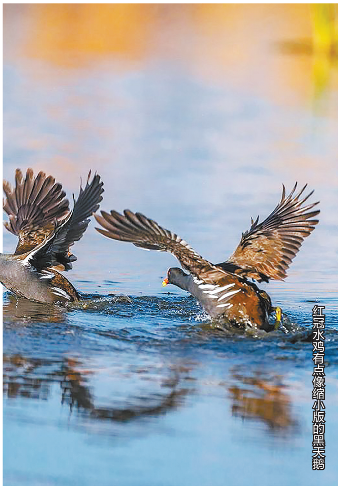
红冠水鸡有点像缩小版的黑天鹅

长了一张熊猫脸。胆小而机警,行走动作稳健而轻盈,很有美感。10年前,长桥海的长脚鹬非常少,发现两只就很稀奇,现在数量多了,真是拍鸟爱好者的喜讯。