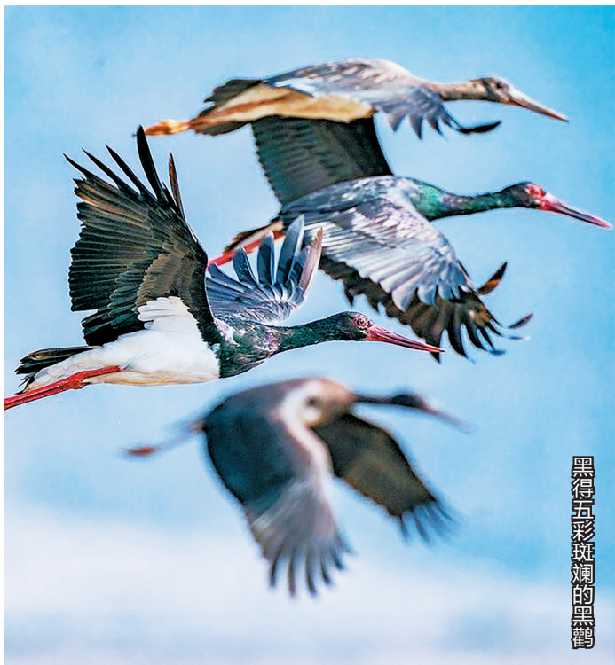
黑得五彩斑斓的黑鹳

全身乌黑,头顶一道白色羽毛。白骨顶鸡属于中型游禽,像小野鸭一般,在水草较多的地方栖息。它们在池塘和沼泽地中繁殖,在迁徙或越冬时,则聚集成数十只的大群。食性主要以植物为主,吃水生植物的嫩芽、叶、根,也吃小鱼、小虾等。遇有敌害能较长时间潜水。