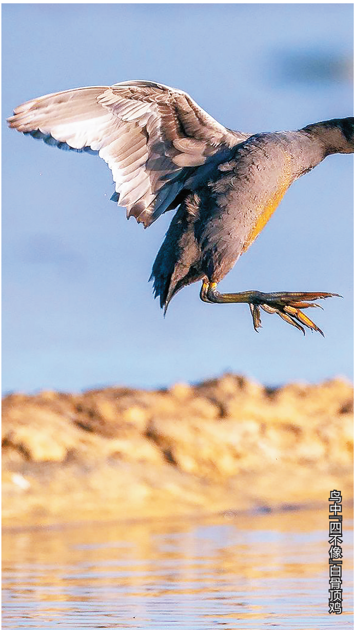
鸟中「四不像」白骨顶鸡

我和小伙伴们在长桥海全是野拍,这里没有修建完好的拍鸟点和鸟棚。野拍的照片背景可能不够干净,画面可能不够精致,但能拍到野生鸟类的自然状态。我和小伙伴们凭着一腔热爱和执着,在水道沟渠旁、树林草丛间,细心地寻觅、耐心地等待……一旦发现并拍到心仪的鸟儿,那种惊喜和成就感,让之前一切的辛苦劳累都化为甘甜、快乐、幸福,这就是野拍的乐趣。