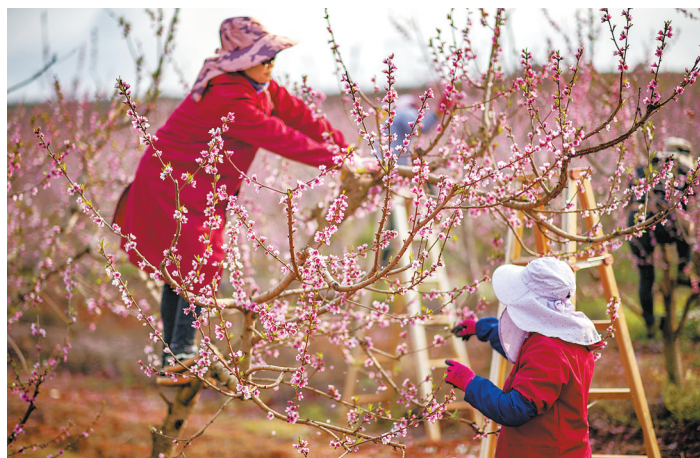
文山市一处蜜桃基地里农民在疏花