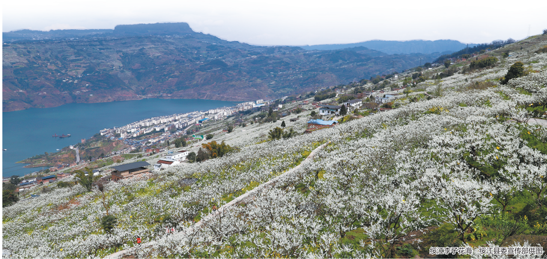
绥江李子花海