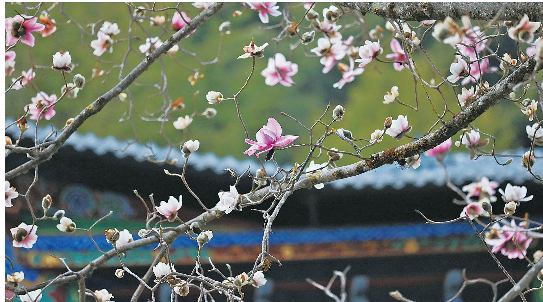
“稀世奇花”木莲花在大理宝台山盛放