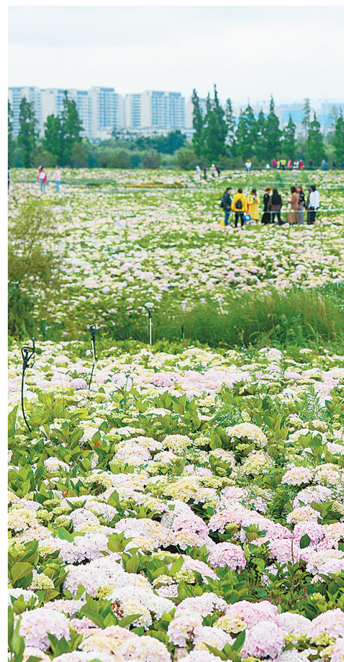
斗南湿地公园绣球花盛放

本报讯（记者 朱海）3月9日，云南省导游协会、云南省旅行社协会共同发布《让我们共同致力于“有一种叫云南的生活”——致广大导游和游客朋友的一封信》，承诺不断擦亮云南旅游“金字招牌”，邀请广大游客朋友来云南沉浸体验“有一种叫云南的生活”。 信中介绍，云南自然风光秀美、民族风情浓郁，被誉为“植物王国”“动物王国”“世界花园”。这里有亚洲象北上南归的温暖之旅、红嘴鸥漂洋过海的春城之约，有西双版纳的热带雨林、苍山洱海的风花雪月、泸沽湖的雨过天晴，还有云南文旅人热情、周到、专业的服务。 信中表示，今年以来，云南旅游市场持续火热，游客朋友不断增多。提供更多优质的旅游服务，展示导游的职业道德、专业素养，让广大游客有宾至如归的感觉，增强旅游体验感，是云南旅游始终不渝的努力方向。一个旅行团是一个大家庭，结伴而行的游客朋友，在旅途途中要相互谦让、文明旅游。游客朋友和导游要换位思考、包容互鉴，导游要多站在游客的角度想一想，游客也要尊重和理解导游人员的辛勤劳动和付出。同时，我们始终保持对一切违法违规行为的“零容忍”态度，接受大家的监督。希望通过共同努力，不断擦亮云南旅游“金字招牌”，使广大游客朋友通过来云南旅游放松身心、体验美好、拥抱幸福，沉浸体验“有一种叫云南的生活”。