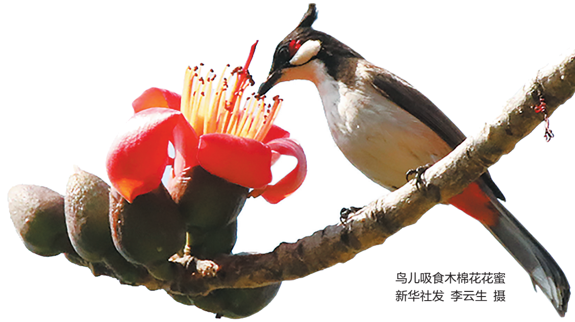
鸟儿吸食木棉花花蜜