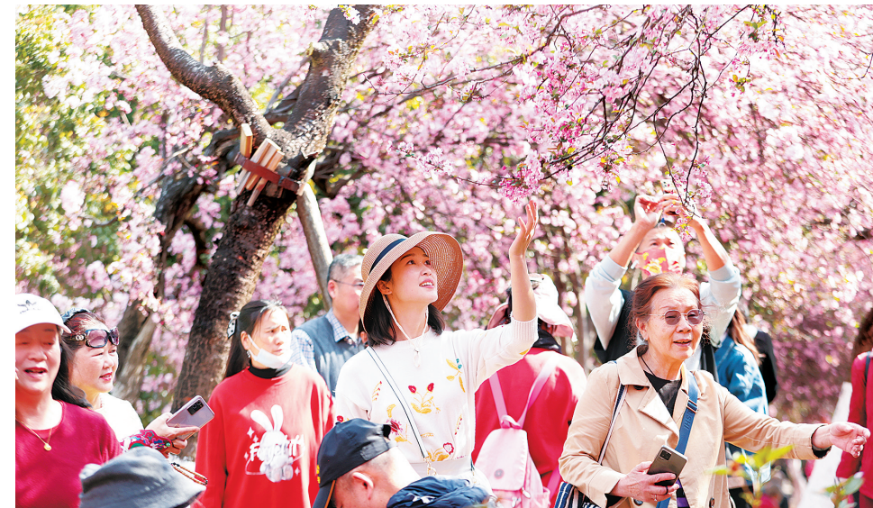
阳春三月，昆明动物园樱花和垂丝海棠盛放。