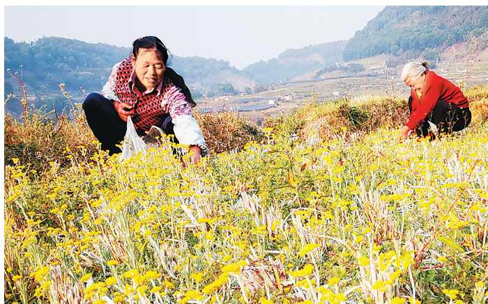
龙陵村民采摘黄花制作黄花粑粑