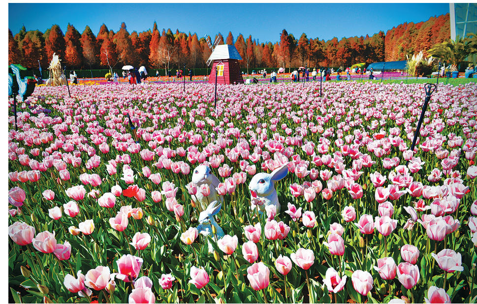
近日，昆明捞渔河湿地公园100万余株郁金香形成花海。